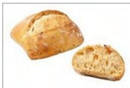
Suggestion de présentation

Produit cuit : Poids moyen : 45g (à titre informatif) Longueur : 7.5 cm ± 1.5 cm Largeur : 5.0 cm ± 1.5 cm Hauteur : 4.0 cm ± 0.5 cm